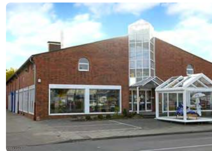
1.000 qm im Fledder, Hannoversche Str. 54, 49084 Osnabrück