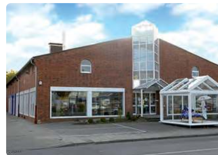
1.000 qm im Fledder, Hannoversche Str. 54, 49084 Osnabrück

Betten Kirchhoff GmbH & Co. KG Georgstraße 10 · 49074 Osnabrück · Tel.: 05 41/ 3 58 44-0 · Fax: 05 41/ 3 58 44-54 Hannoversche Straße 54 · 49084 Osnabrück · Tel.: 05 41/ 3 58 44-44 info@betten-kirchhoff.de · www.betten-kirchhoff.de