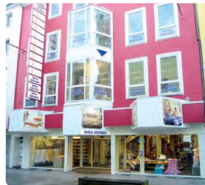
Drei Etagen in der City, Georgstraße 10, 49074 Osnabrück