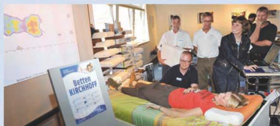
z.B. Messestand im Haus des Theaters Osnabrück

Beispielthemen: Liegervmessung mit Computertechnologie, Elektromog am Schlafplatz, Schlafhöhlenklima und neuste Materialien, Bettausstattung speziell für Allergiker, Schlafhygiene, Besichtigung unserer Federnwaschanlage.