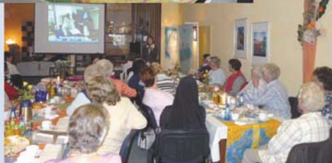
z.B. Vortrags- veranstaltung in unserem Räumlichkeiten

Wir sind Kooperationspartner der Initiativen: